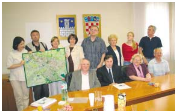
Sudionici radionice u Čakovcu

CENTRIS i Zaklada, uz stručnu pomoć istraživačica MAP Savjetovanja, započeli su izradu Studije o socijalnom kapitalu u Republici Hrvatskoj . U okviru tog projekta provedena je izrada profila zajednice i mapiranje resursa u dva nagrađena grada: Čakovcu i Donjem Miholjcu. Rezultati istraživanja će poslužiti Zakladi u budućem radu na potpori razvoju lokalnih zajednica i međusektorske suradnje.