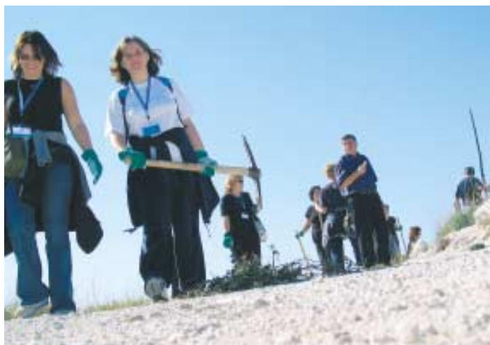
Volonterska akcija na Štedrici