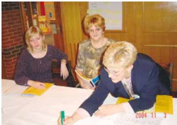
Radionica o pisanju projekata za CARDS 2002, održana u Bizovcu

23. rujna 2004. godine održana je Nacionalna prezentacija CARDS 2002 projekta “Pružanje usluga u zaštiti zdravlja, socijalnoj skrbi i izvaninstitucionalnom obrazovanju” u Kristalnoj dvorani hotela “Opera” u Zagrebu. Na prezentaciji su govorili potpredsjednica Vlade Republike Hrvatske, gospođa Jadranka Kosor i šef Delegacije Europske komisije u Republici Hrvatskoj, gospodin Jacques Wunenburg kao i predstavnici projektnih partnera uključenih u ovaj projekt CARDS 2002. Nakon Nacionalne prezentacije održane su, tijekom listopada, i četiri regionalne prezentacije rada Zaklade i CARDS projekta u Rijeci, Osijeku, Splitu i Zagrebu.