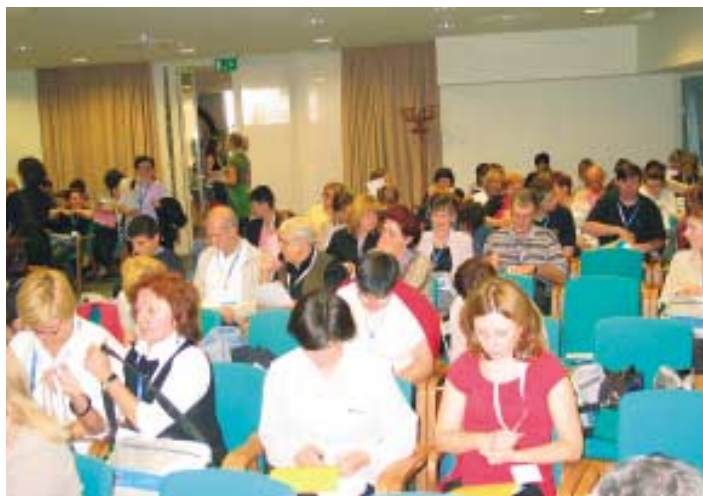
Prva nacionalna konferencija o volonterstvu

Na Prvoj nacionalnoj konferenciji o volonterstvu sudjelovalo je 218 predstavnika/ca organizacija civilnoga društva, jedinica lokalne samouprave, predstavnika i predstavnica tijela državne uprave te osnovnih škola iz cijele Hrvatske. Rad Konferencije odvijao se kroz 4 radionice, a završio velikom volonterском akcijom pošumljavanja opožarenog područja Štedrica u Dubrovačkom primorju sadnjom 300 sadnica pinija. Akcija je provedena uz pomoć Udruge “Dupinov san”, Hrvatskih šuma koje su donirale sadnice pinija i Zagrebačke banke koja je sponzorirala prijevoz do opožarenog područja.