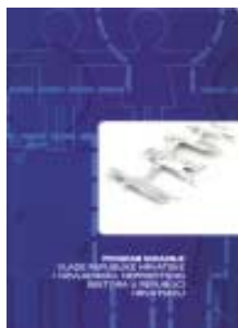
Program suradnje Vlade RH i nevladinog, neprofitnog sektora u Hrvatskoj

Nacionalna zaklada u svom radu, od samog početka, koristi Open Source operativni sustav LINUX.