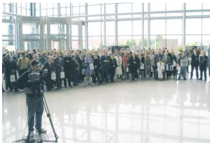
Prezentacija Zaklade u NSK