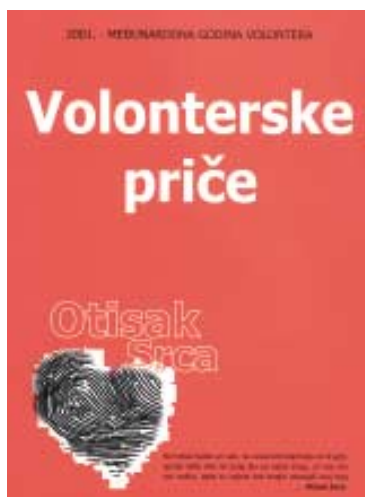
Naslovnica knjige “Volonterske priče”

Jedan od najvažnijih rezultata Konferencije je i izrada konačnog teksta Nacrta prijedloga zakona o volonterstvu kojeg je Zaklada, sukladno zaključcima Konferencije, poslala Ministarstvu obitelji, branitelja i međugeneracijske solidarnosti kako bi i službeno bio upućen u proceduru usvajanja u Vladi RH, a potom i Hrvatskog sabora. Zaklada je tiskala Bilten Prve nacionalne konferencije o volonterstvu u crnom tisku i na Brailleovom pismu koji je poslan svim sudionicima i sudionicama Konferencije, ostalim udrugama i svim relevantnim institucijama u javnom i poslovnom sektoru u Hrvatskoj. Pored toga Zaklada je u povodu održavanja Prve nacionalne konferencije o volonterstvu tiskala i drugo izdanje knjige “Volonterske priče” .