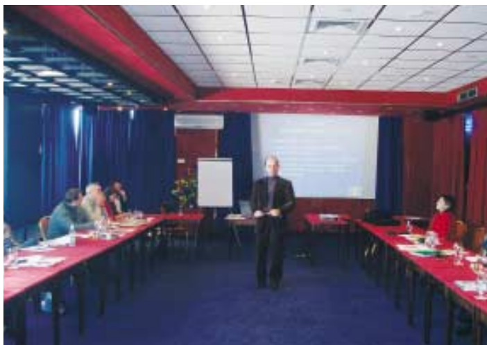
Seminar za polaznike Programa izobrazbe o EU, održan u Opatiji

24. rujna 2004. godine raspisan je natječaj Zaklade i ECAS-a (European Citizens Action Services) iz Bruxellesa za iskaz interesa za sudjelovanje u Programu informiranja i izobrazbe o EU za 25 predstavnika/-ce udruga iz Hrvatske. Program izobrazbe, traje 5 mjeseci, a namjerava potaknuti aktivnije sudjelovanje hrvatskih organizacija civilnoga društva u procesu integriranja Hrvatske u Europsku uniju te njihovo bolje povezivanje s krovnim nevladinim mrežama koje djeluju na razini EU u Bruxellesu. Izobrazba 25 polaznika i polaznica Programa započela je 14. siječnja 2005. godine, a uključuje pet seminara u Hrvatskoj, kao i jednotjedno studijsko putovanje u Bruxellesu u travnju 2005. godine u okviru kojega će biti održano predstavljanje hrvatskih organizacija civilnog društva u Europskom parlamentu. Osim toga, najuspješniji sudionici i sudionice Programa dobit će stipendije ECAS-a za jednomjesečno stažiranje u renomiranim udrugama u Bruxellesu. Po završetku izobrazbe, polaznici bi trebali postati specijalisti za europske integracije u nevladinom sektoru, osposobljeni da aktivno pridonese procesu integriranja Hrvatske u EU, u djelotvornom partnerstvu s državnim institucijama. Sam program izobrazbe osmišljen je u uskoj suradnji s Ministarstvom europskih integracija čiji su službenici uključeni i kao predavači na nekoliko seminara.