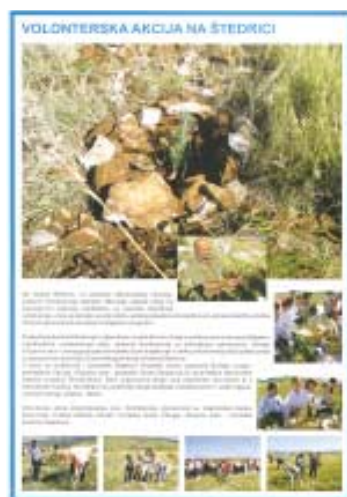
Stranica biltena Konferencije

U prigodi 5. 12. - Međunarodnog dana volontera, Zaklada je poslala svim volonterskim centrima u Hrvatskoj promotivne poklone (plakate, čokoladice, balone i bedževe s logom “Otisak srca”) za zamolbom da ih podijele volonterima u njihovoj regiji. S nekoliko dopisa poslanim u studenom svim gradovima u Hrvatskoj motivirani su gradski čelnici za uključivanje u javno priznavanje i vrednovanje volonterskog rada što su mnogi i učinili. Zaklada je u dogovoru s HTV-om osigurala prikazivanje spotova o volonterima, a u suradnji s Hrvatskim radijem te komercijalnim radio postajama emitiranje prigodnih radijskih spotova s čestitkom svim volonterima za Međunarodni dan volontera.